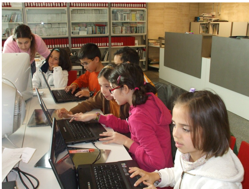
Figura 4.- Detalle de un grupo de trabajo infantil

Este grupo siempre ha destacado por su participación y complicitad, además de por su constancia e implicación. Este ha sido un ejemplo del conjunto de sus características.