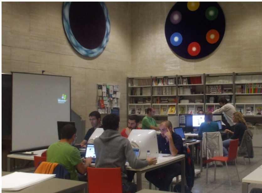
Figura 2.- Detalle de un grupo de trabajo de adultos

Los adultos se dividieron en dos grupos en horario de mañana y un grupo en horario de tarde, correspondiendo con una hora libre de obligaciones laborales en muchos casos: de 20 a 21,30hs. La participación fue muy numerosa y se cubrieron todas las plazas en la primera semana.