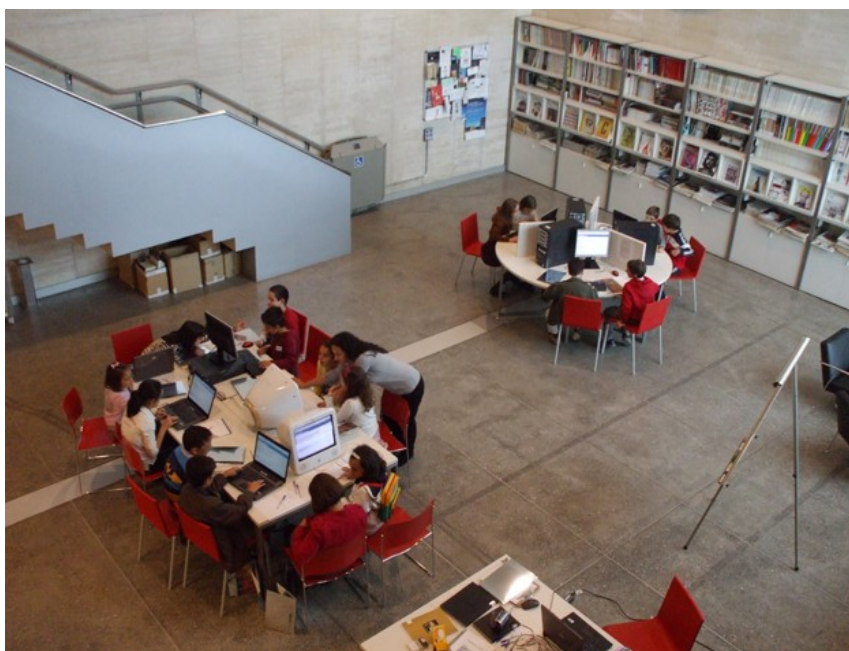
Figura 3.- Un grupo de trabajo infantil

Por lo tanto, para realizar los grupos de Virtualizarte , se eligieron niños y niñas que superan los 12 años de edad para el grupo de los sábados por la tarde, al que se les enseñó a utilizar la herramienta Web 2.0 Blogger a un nivel un poco superior que a los pequeños y a un grupo de entre 7 y 12 años. Debido a la gran demanda de la actividad de los más pequeños, se crearon dos grupos, los domingos por la mañana.